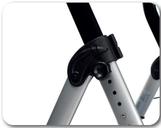
Verstärkte Verschraubung für mehr Sicherheit und Stabilität