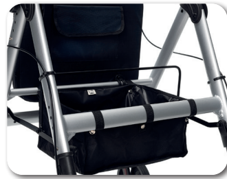
Verstecktes Einkaufsfach (Achtung, kein Einkaufskorb, nicht entnehmbar)