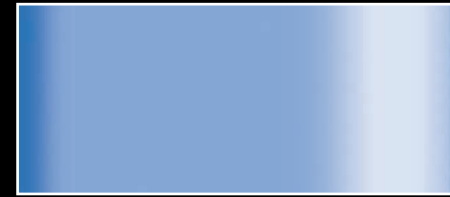
C56M - Blaugrau matt C56G - Blaugrau glänzend