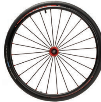
Spirit Räder rot 24"