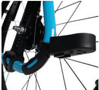
Gehstützenhalter links oder rechts B31L oder B31R