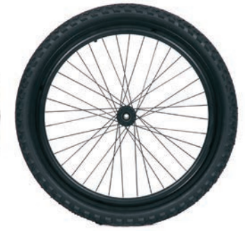
Off-road Räder 24"