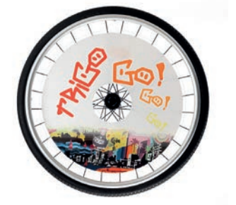
Speichenschutz finden Sie auf unserer Webseite: www.vermeiren.de

Weitere Optionen und Zubehör finden Sie auf unserem Bestellbogen.