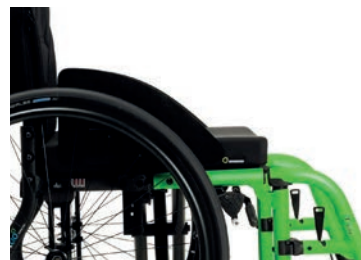
B82S-C Abnehmbarer- und verstellbarer Kleiderschutz aus Carbon