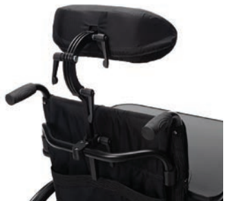
Höhenverstellbare Kopfstütze B47