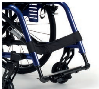
Monobloc, mit klappbarer Fußplatte