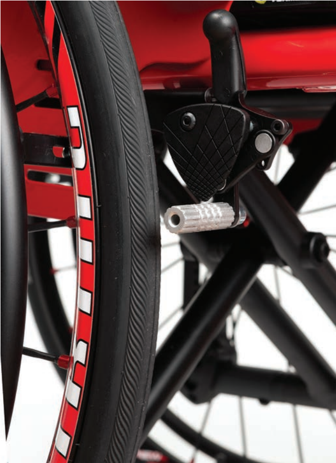
Druck- oder Ziehbremsten