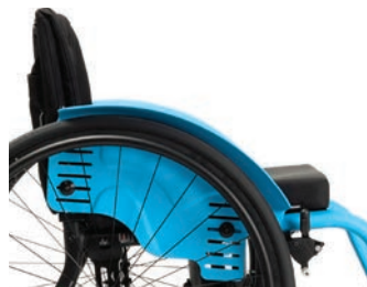
B82 fester und verstellbarer Kleiderschutz, Aluminium mit Kotflügel