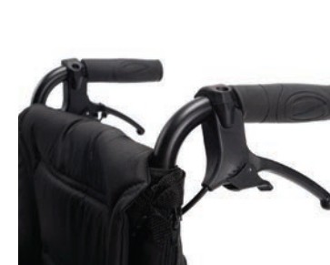
Trommelbremse 24» x 1/3 8» graue Räder