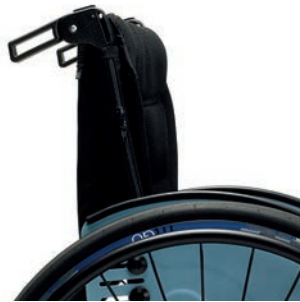
PH 05 höhenverstellbare Schiebegriffe (hinter Rückenrohr)