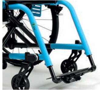
Monobloc, Fußplatte aus Aluminium, faltbar