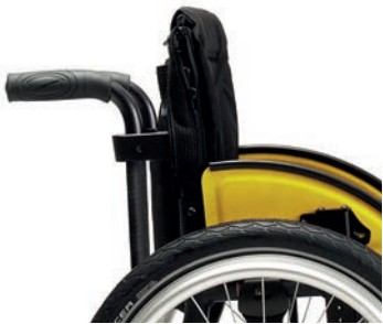
PH 04 höhenverstellbare Schiebegriffe (innenliegende Rückenrohre)