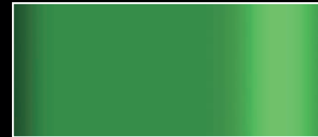
C73G - Grünmetallic