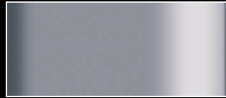
C55M - Inox matt C55G - Inox glänzend