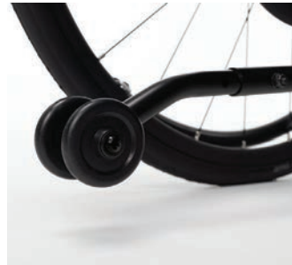
Kippstützen links oder rechts B78L oder B78R