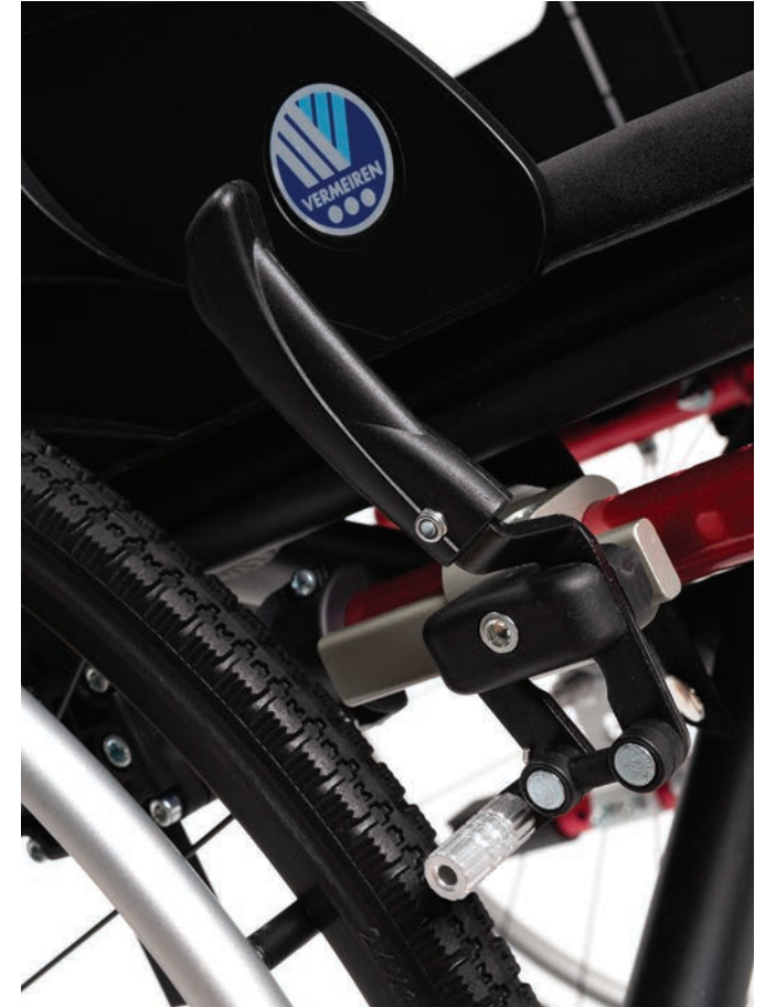
Standardbremsen mit klappbaren Griffen (B40)