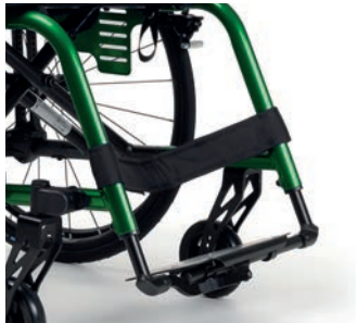
Monobloc, Fußplatte carbon, klappbar