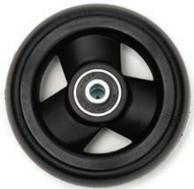
Standard schwarz 3", 4", 5", 6"