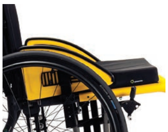
B82SL-A Langer, abnehmbarer Kleiderschutz aus Aluminium