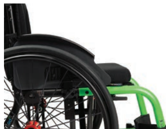
B82L-A Langer, abnehmbarer und verstellbarer Kleiderschutz mit Kotflügel, Aluminium