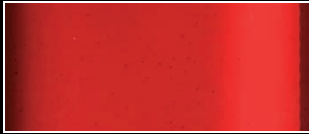
C4M - Rot matt C4G - Rot glänzend