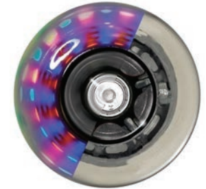
LED 4", 5"