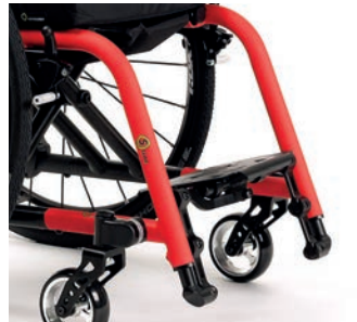
Monobloc, mit höherer Fußplatte