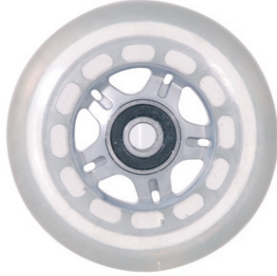
Transparent 3", 4", 5", 6"