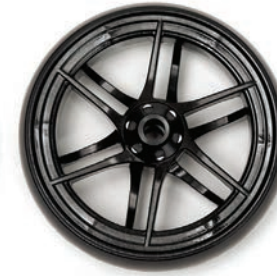
Carbon 4", 5"