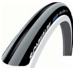
Right Run Räder schwarz erhältlich mit Design- und Spiriträdern