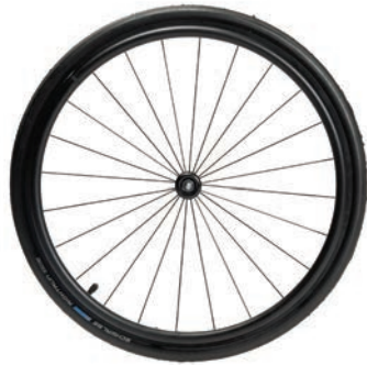
Designräder 20", 22", 24", 26"