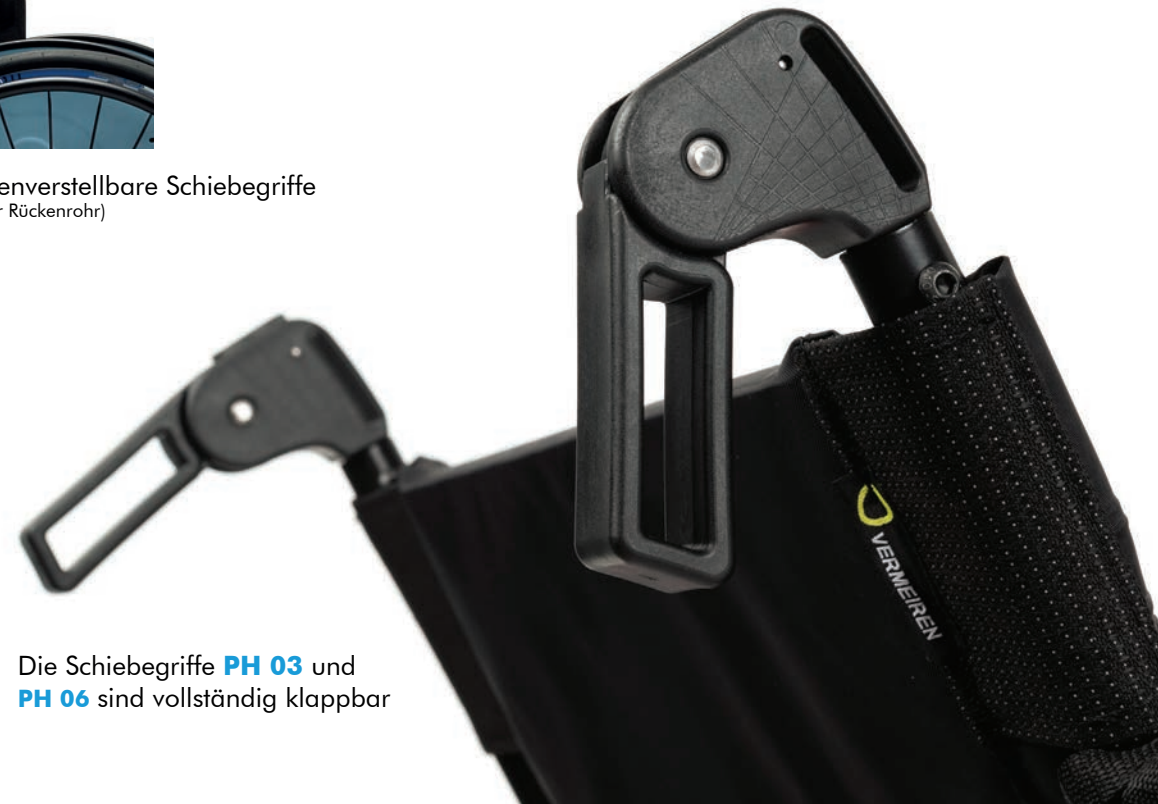
Die Schiebegriffe PH 03 und PH 06 sind vollständig klappbar