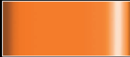
C53M - Orange matt C53G - Orange glänzend