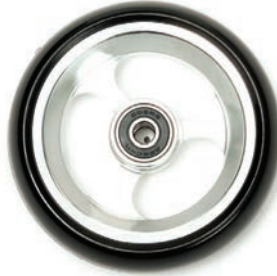
Aluminium silber 3", 4", 5"