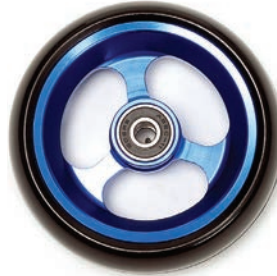
Aluminium blau 3", 4", 5"