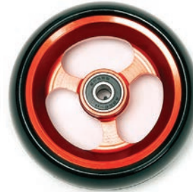
Aluminium rot 3", 4", 5"