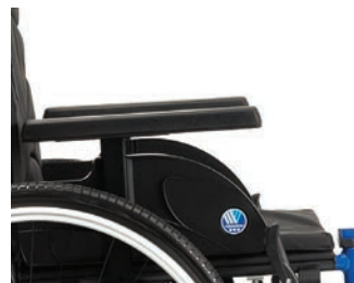
Bi5 höhenverstellbare Armlehnen