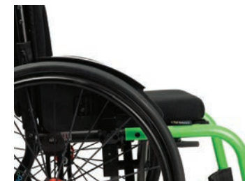
B82-C Langer, abnehmbarer und verstellbarer Kleiderschutz mit Kotflügel, Carbon