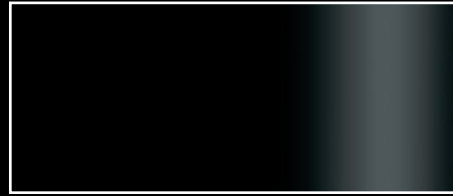
C5M - Schwarz matt C5G - Schwarz glänzend