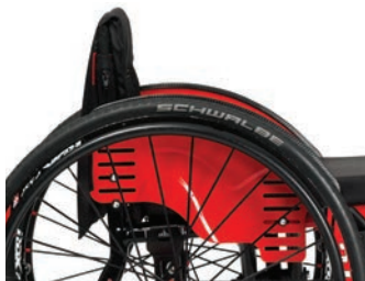
B82-S und B82-C fester und verstellbarer seitlicher Kleiderschutz, Aluminium oder Carbon