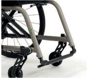
Monobloc, Rohr aus Aluminium

erhältlich in den Winkeln: 70°, 80° und 90°