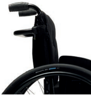
PH 01 feste Schiebegriffe (12 cm) PH 02 feste kurze Schiebegriffe (8 cm)