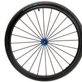
Spirit Räder blau 24"