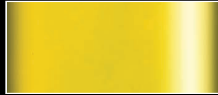
C8M - Gelb matt C8G - Gelb glänzend