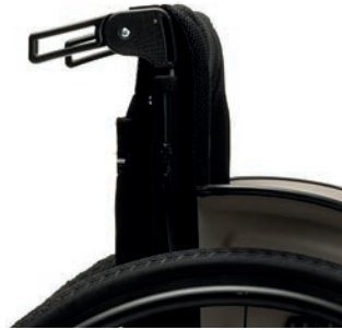
PH 03 feste klappbare Schiebegriffe