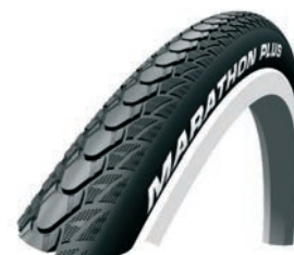
Marathon Plus Räder erhältlich mit Design- und Spiriträdern