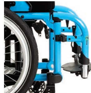
BA6 Fußstützen, um 5 cm verkürzt