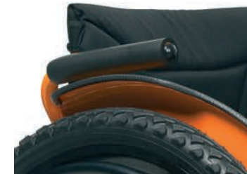
TUBE Armlehnen, nach hinten versenkbar (nur mit festem Rücken)