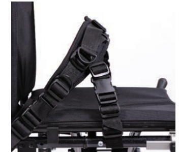
Neoflex-Gurte finden Sie auf unserer Webseite: www.vermeiren.de