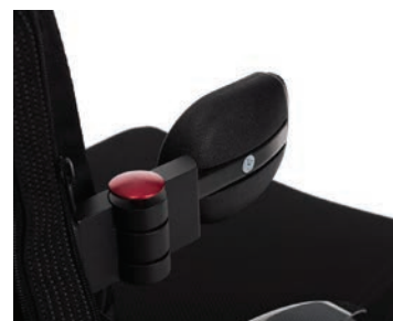
Seitenpelotten links oder rechts (kleine Ausführung) L04S L oder L04S R