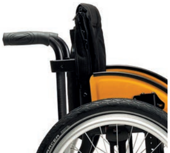
PH 06 faltbare und höhenverstellbare Schiebegriffe (hinter Rückenrohr)